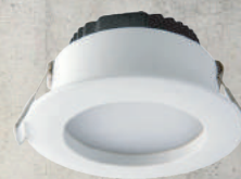
12103B - Blanc en 3000K