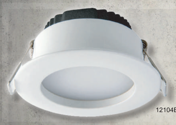
12104B - Blanc